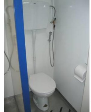
Particolari d'interno: a sx. cabine doccia - ingresso/svincolo con lavatoio a dx. - a dx cabine con "vaso standard"