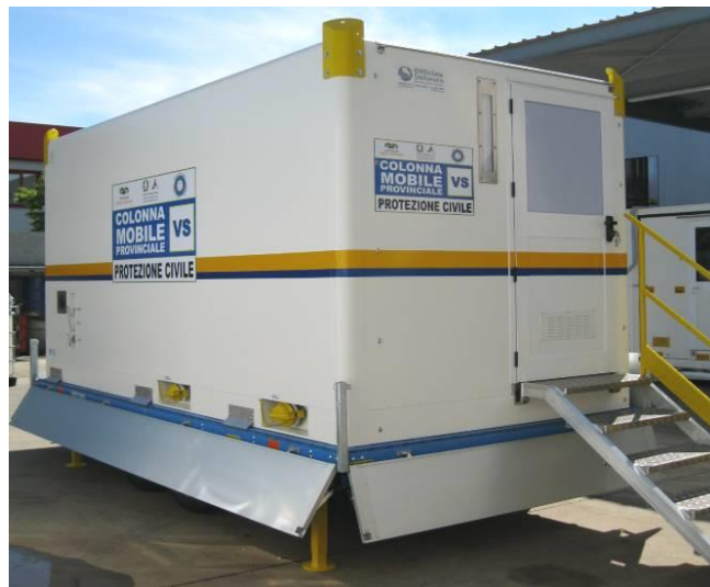
Vista del complesso su angolo posteriore/ingresso e fianco con attacchi/allacciamenti