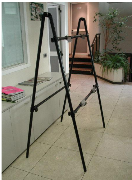
Vista del telaio montato