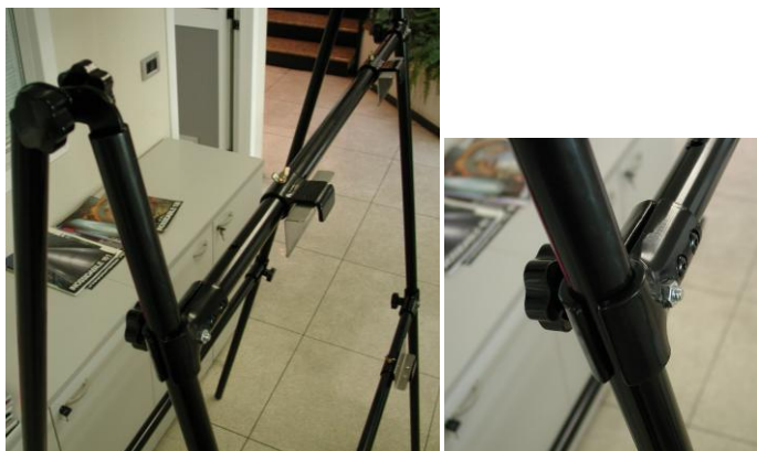
Particolari del telaio