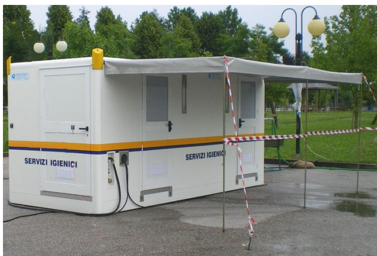
Vista del complesso su angolo vano tecnico e fiancata ingressi, posto a terra