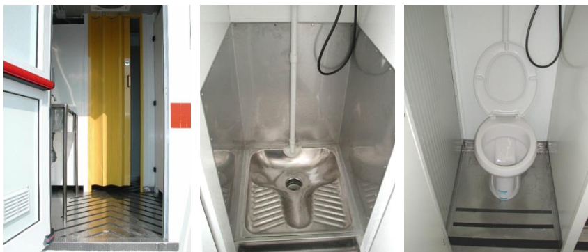
Particolari d'interno: ingresso/svincolo - cabina con "turca" - cabina con "vaso standard"