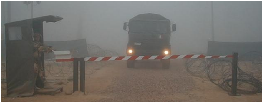
Sbarra Ingresso Smontabile Campale